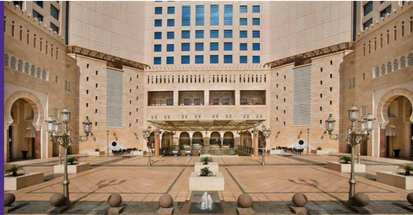
فندق أنجم – المرحلة ٢ Anjum Hotel - Phase 2