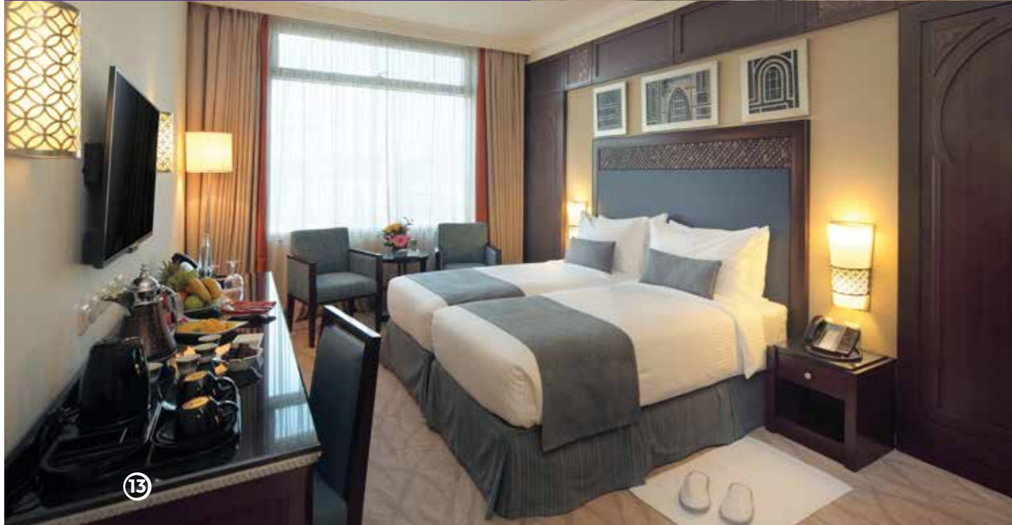
1743 غرفة Rooms