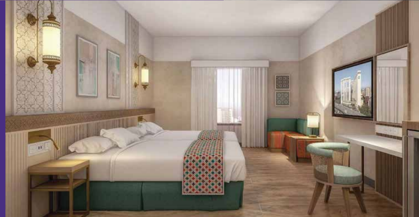
3977 غرفة Rooms